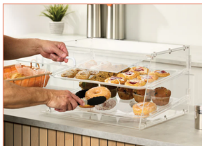
Los modelos ADC-2 y ADC-4 cuentan con un asa en la parte frontal para la opción de autoservicio.