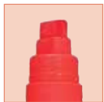
Marcadores Deluxe Plus con punta de cincel ancha