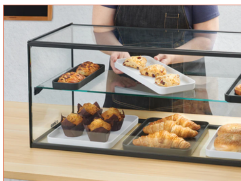
El camarero lleva puesto un delantal vaquero Signature Chef™ #BADN-3126

Se muestra utilizando bandejas de melamina de la serie MMP.