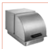
Cerrado en una bandeja para alimentos