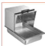
Abierto sobre una bandeja para alimentos