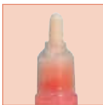
Marcadores de punta de bala estándar