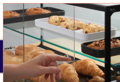
Exhibidores de vidrio empaquetados en kit plano. Fácil de ensamblar.

Las puertas traseras se abren y cierran fácilmente deslizándolas entre las muescas.